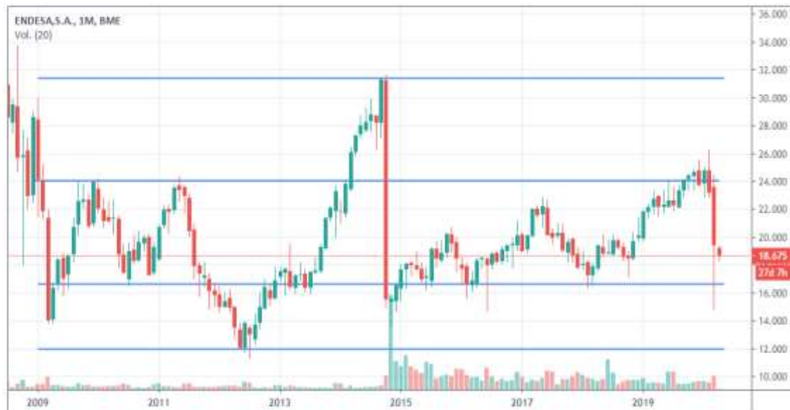
Figura 3. Soportes y resistencias

Como tercer elemento importante encontramos los soportes y resistencias 37 , son términos que se utilizan para denominar a niveles de precios determinados y entre ambos limitan el rango de movimiento del mercado. Es decir, el nivel de soporte se establece donde el precio deja de bajar regularmente y vuelve a subir, mientras que el nivel de resistencia donde el precio normalmente deja de subir y vuelve a bajar.