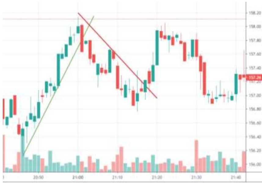
Figura 2. Ejemplo de tendencias