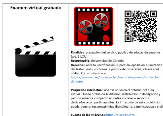
Figura 2.- Inscripción correspondiente a pruebas con grabación para publicar en Moodle junto con el resto de información sobre la prueba.

El profesorado deberá publicar en el espacio web de la asignatura, junto con la información antes mencionada, la inscripción que corresponda a su caso: figura 1 2 para sesiones sin grabación y figura 2 3 para sesiones con grabación.