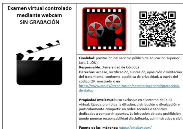
Figura 1.- Inscripción correspondiente a pruebas sin grabación para publicar en Moodle junto con el resto de información sobre la prueba.

la grabación de su imagen, el profesor podrá arbitrar otras medidas y modalidad de evaluación que acrediten su identidad y la correcta autoría de la prueba. 1 2) Las condiciones que debe reunir el espacio destinado a su realización, asegurando la ausencia de terceras personas no concernidas. Además, se recordará la exclusión de responsabilidad de la Universidad de Córdoba en relación con la afectación de la vida privada o familiar de profesores y/o estudiantes.