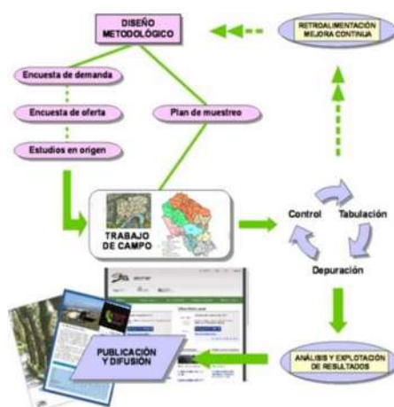
Proceso de investigación de las encuestas en destino