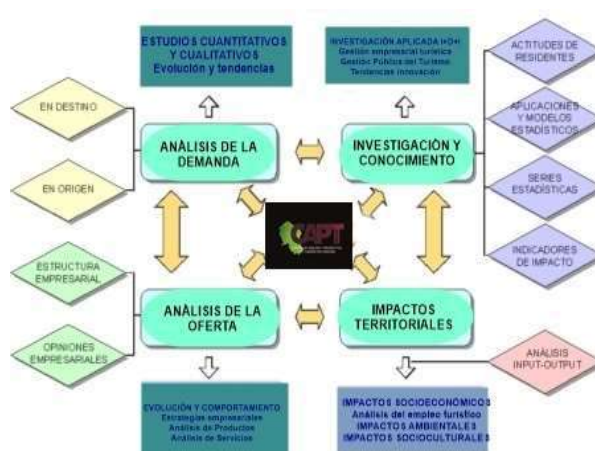
Líneas de actuación del SITCOR